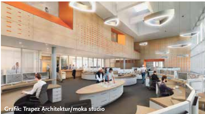
Grafik: Trapez Architektur/moka studio

nicht in den Boden. Landrat Oliver Stolz auf der Feierstunde am Montag: „Es handelt sich um ein Bauvorhaben, das uns alle angeht.“ Die alte Leitstelle habe Mängel und sei zu klein. Er danke der Politik, die hohe Verantwortung gezeigt habe, um eine Investition von nahezu 20 Millionen Euro auf den Weg zu bringen.