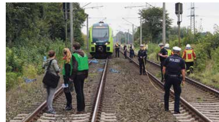
Ein Großaufgebot an Ermittlern war vor Ort am Bahnübergang Papenhöhe. Der gestoppte Zug mit etwa 120 Reisenden an Bord konnte erst gegen 9.30 Uhr in den Elmshorner Bahnhof einfahren.

Die Reisenden, darunter etliche Schulkinder, mussten stundenlang im Zug ausharren, weil zunächst Spuren und Fundstücke an der Unfallstelle gesichert werden mussten. Auch hatte der Zugführer einen Schock erlitten, so dass ein anderer Fahrer zur Unglücksstelle gebracht werden musste. Erst gegen 9.30 Uhr war der Bereich soweit geräumt, dass die